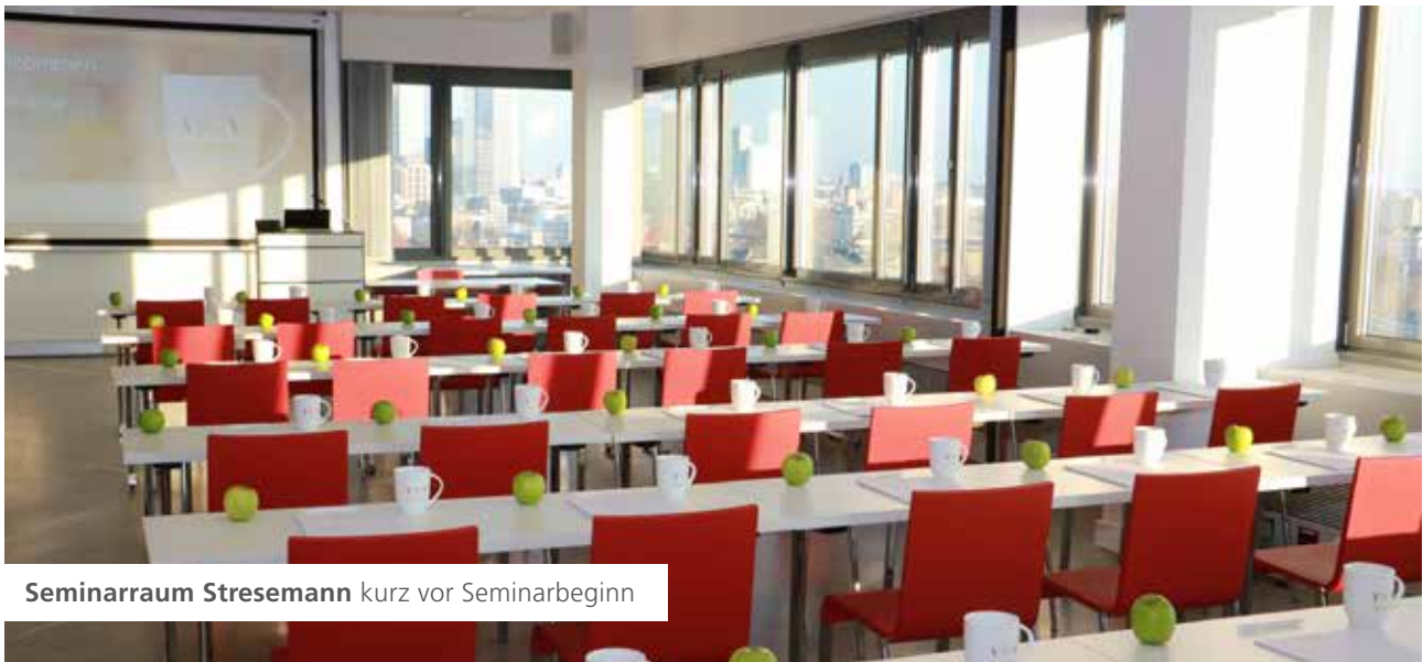
Seminarraum Stresemann kurz vor Seminarbeginn

Ein allgemein bekanntes Sprichwort sagt: Wer rastet, der rostet. Und das bezieht sich nicht nur auf den Körper, auch ist das geistige Wachstum gemeint. Durch stetiges Lernen wird der Geist gefordert und trainiert. Beruflich wie privat bleiben stets Interessierte so auf der Höhe der Zeit. Auch modernen Unternehmen ist es wichtiger denn je, qualifizierte und sich weiterbildende Mitarbeiter zu beschäftigen.