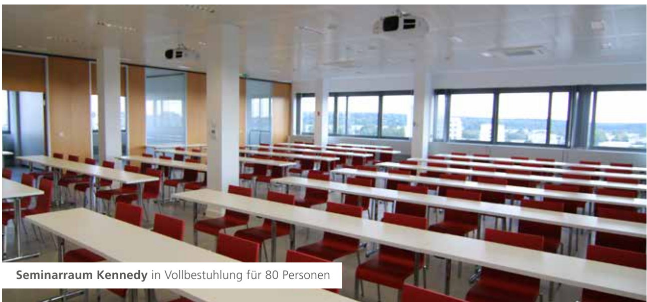
Seminarraum Kennedy in Vollbestuhlung für 80 Personen