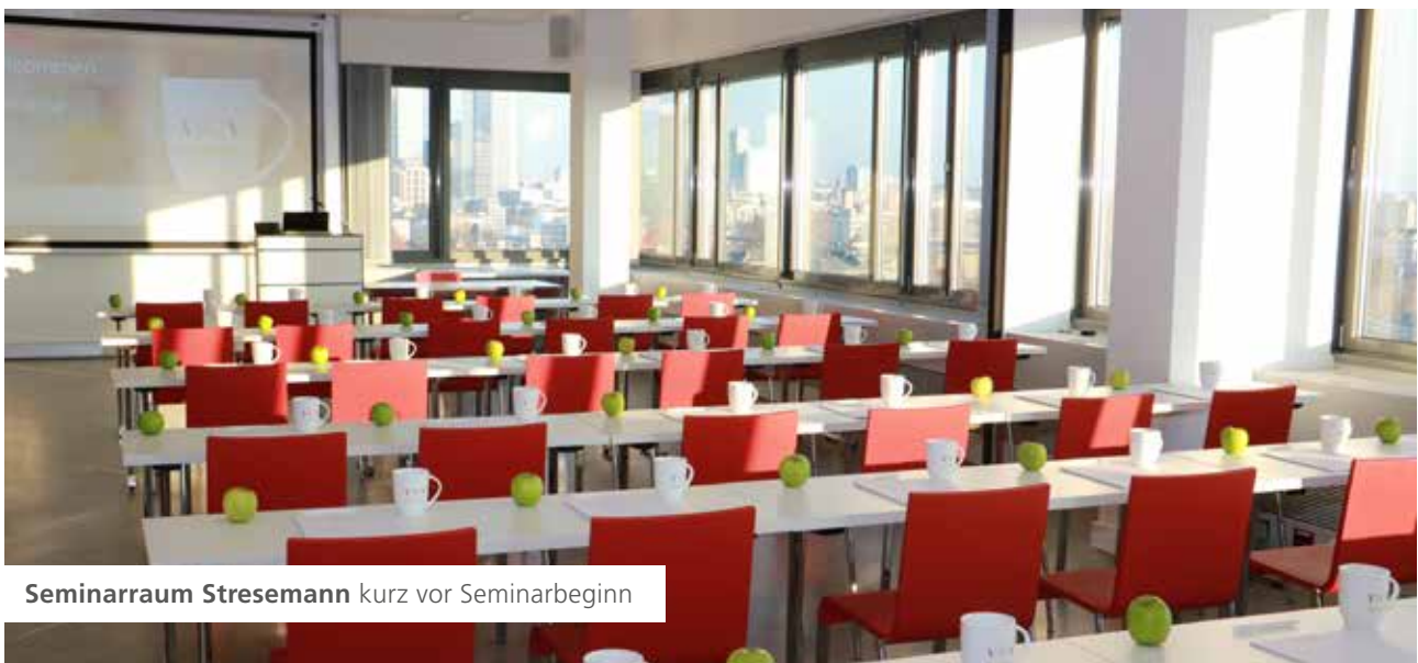
Seminarraum Stresemann kurz vor Seminarbeginn

Ein allgemein bekanntes Sprichwort sagt: Wer rastet, der rostet. Und das bezieht sich nicht nur auf den Körper, auch ist das geistige Wachstum gemeint. Durch stetiges Lernen wird der Geist gefordert und trainiert. Beruflich wie privat bleiben stets Interessierte so auf der Höhe der Zeit. Auch modernen Unternehmen ist es wichtiger denn je, qualifizierte und sich weiterbildende Mitarbeiter zu beschäftigen.