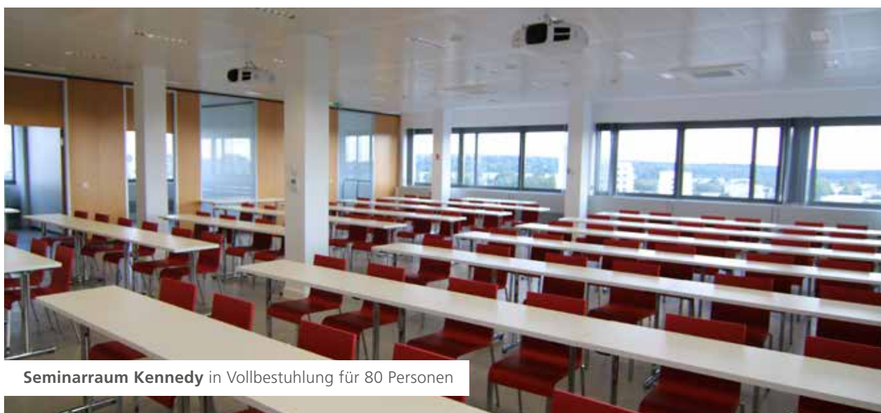
Seminarraum Kennedy in Vollbestuhlung für 80 Personen