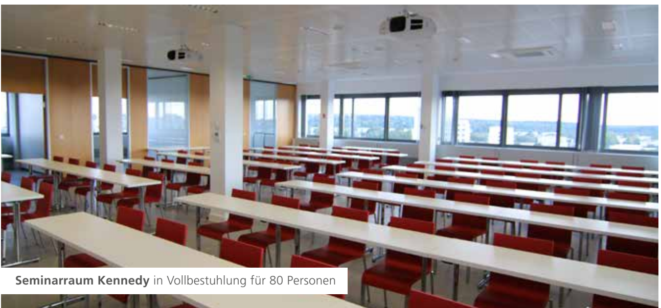
Seminarraum Kennedy in Vollbestuhlung für 80 Personen